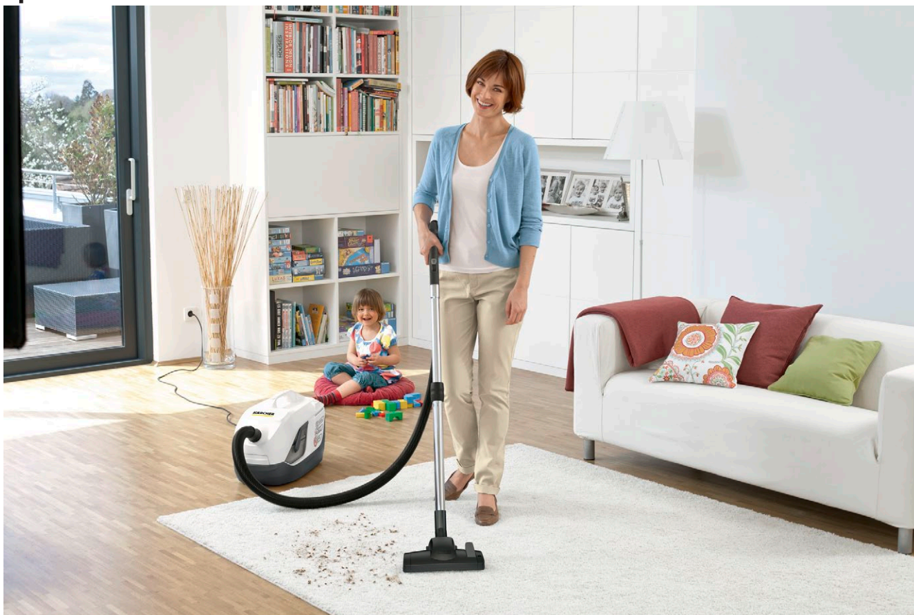
DS 6 Premium Plus